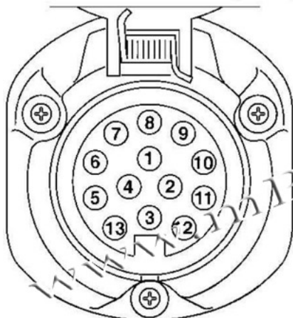
Widok gniazda od strony wtyczki